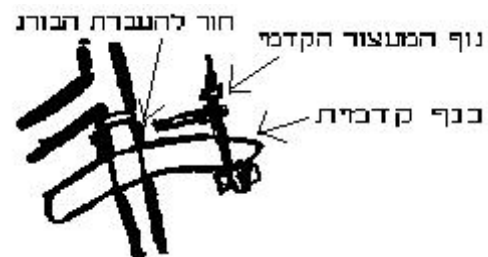
שרטוט 3 הרכבת כנף

4. הרכבת כנפיים ומעצור קדמי: התקן את הכנף האחורית מתחת לסבל. חבר את המעצור הקדמי והכנף הקדמית כמוצג בשרטוט מספר 3