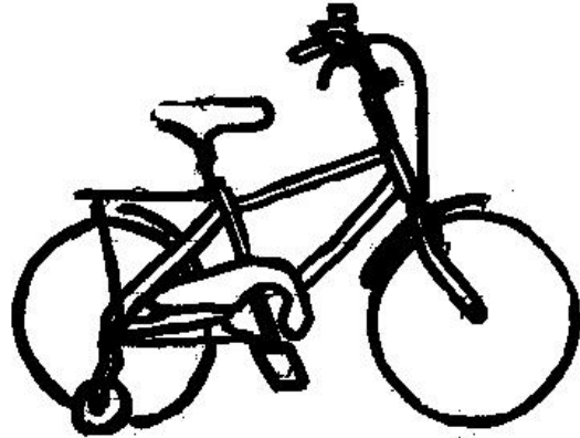
שירטוט 1: אופני BMX

הטקסט כתוב בלשון זכר אך הכוונה לזכר ונקבה באופן שווה. על מנת להתחיל בהרכבה אנא הוצא את כל החלקים מהקרטון וזהה אותם.